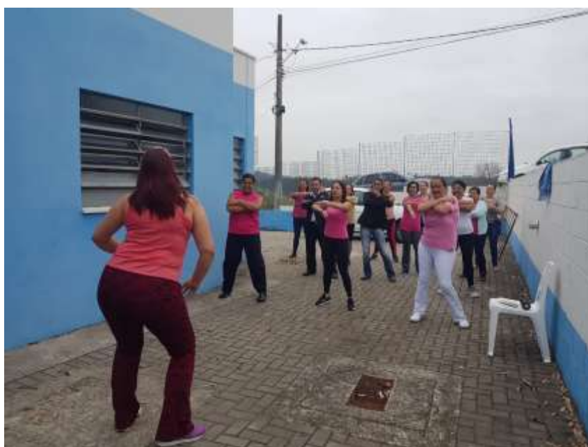
União pela Beneficência Comunitária e Saúde – UNISAU

Outubro Rosa: Todas as Unidades realizaram neste mês, ações sobre Saúde da Mulher, prevenção do câncer de mama e outros, orientação sobre o autoexame grupos educativos, reuniões na comunidade, intensificação nos atendimentos e de coleta de Papanicolau.