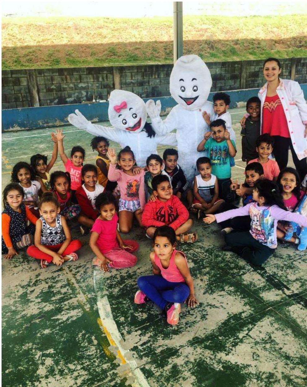
União pela Beneficência Comunitária e Saúde – UNISAU

Várias ações coletivas, grupos de orientações, mutirões de vacinação em escolas, empresas e em pontos estratégicos das comunidades, aconteceram durante todo o ano.