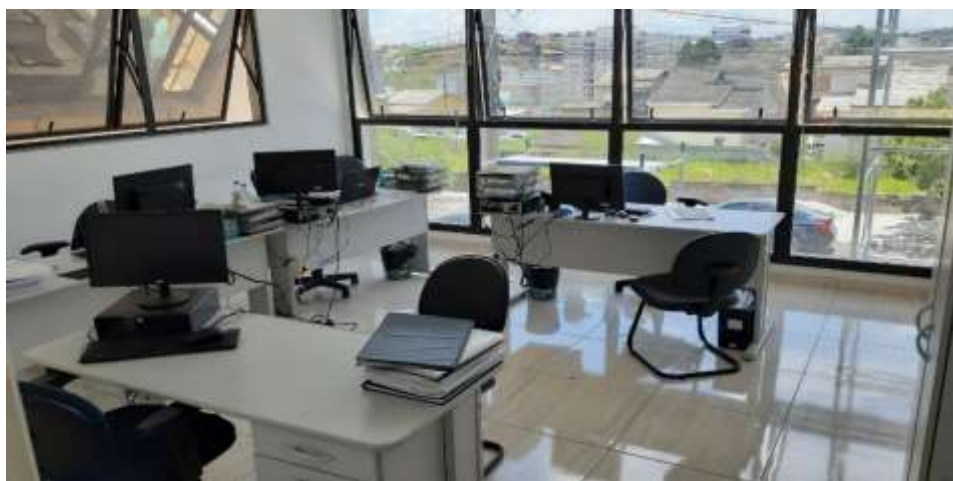
Sala dos Coordenadores

União pela Beneficência Comunitária e Saúde – UNISAU