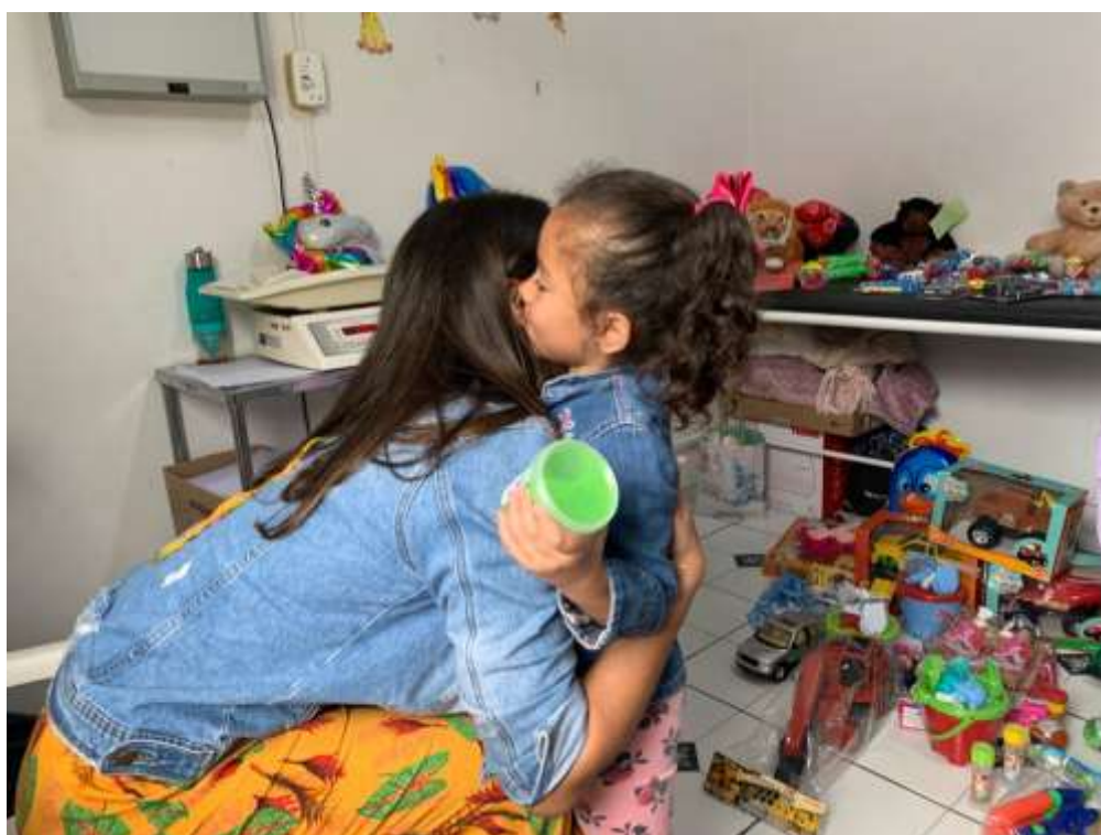
União pela Beneficência Comunitária e Saúde – UNISAU