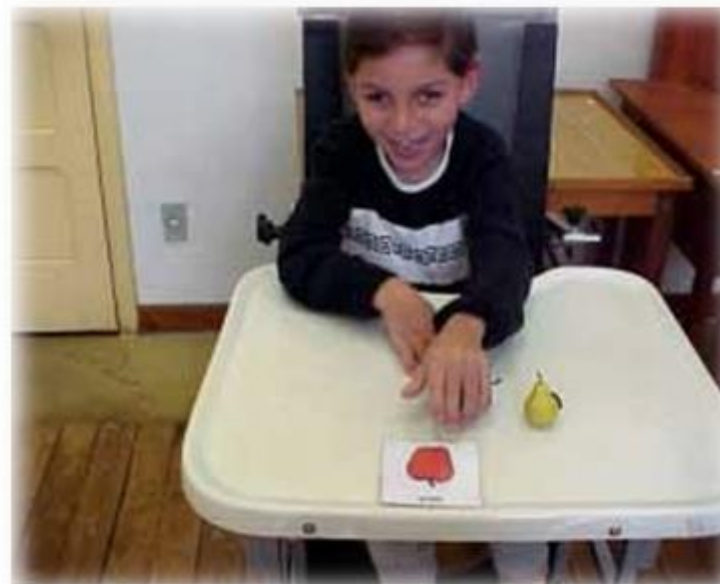
O aluno segura a maçã para indicar a figura correspondente. O objetivo da atividade foi associar a miniatura com a figura correspondente.