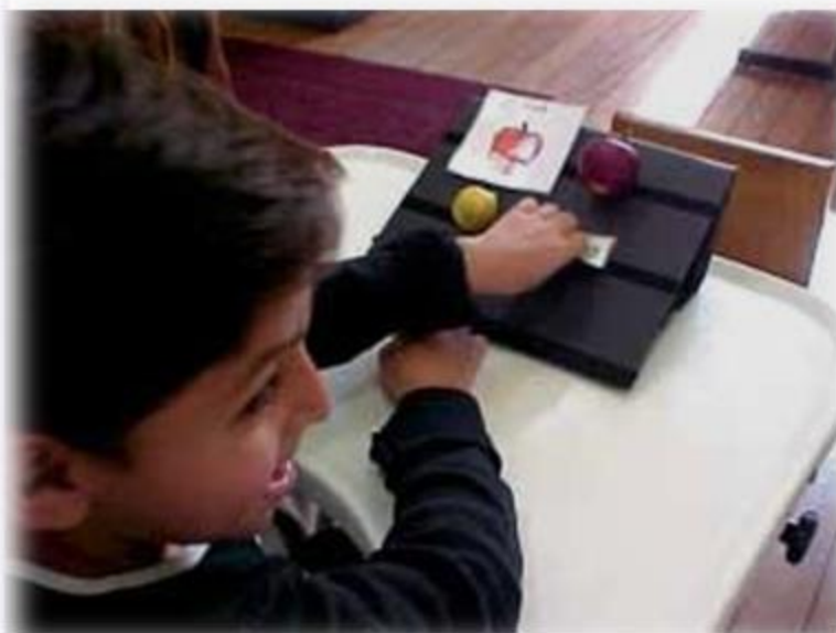
Utilização de miniaturas com figuras e escrita. Para auxílio motor foi utilizado um suporte inclinado.

O tipo de estímulo a ser apresentado pode ser combinado como, por exemplo, miniatura-figura, miniatura-foto, foto-escrita, figura-escrita, lembrando que essa combinação associa estímulos concretos com abstratos. Assim, os sistemas com símbolos gráficos (figuras, fotos, escrita) são mais abstratos do que um sistema composto por objetos ou miniaturas.